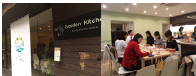
一般消費者モニターでアンケート調査の実施例